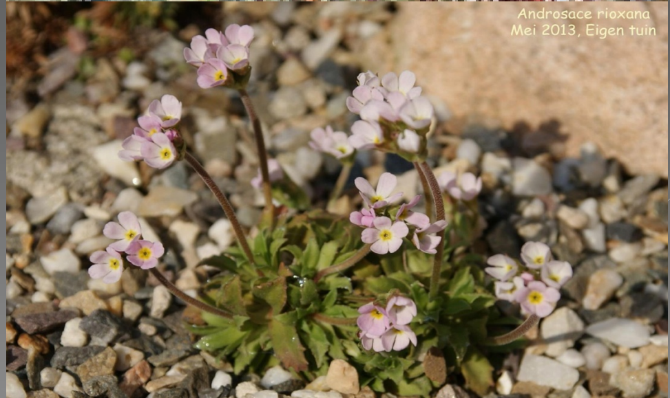
Androsace riojana Mei 2013, Eigen tuin